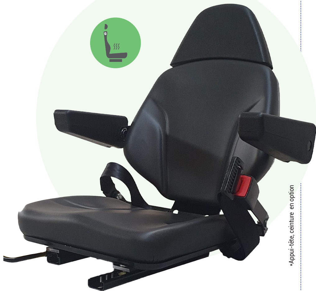
*Appui-tête, ceinture en option